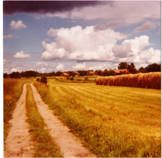
Hö hässjas längs vägen till Kalvhaga.