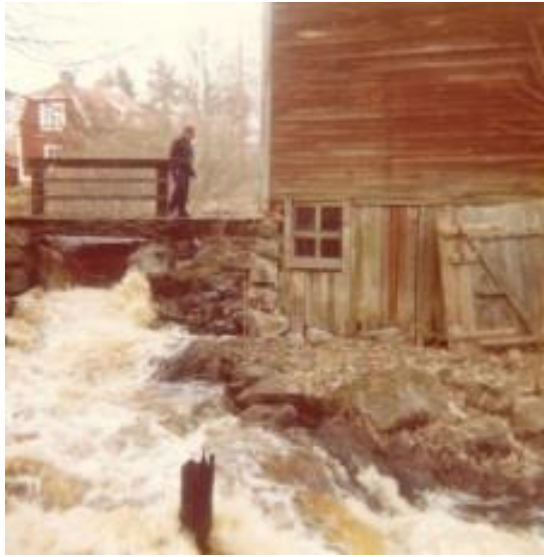
Fors vid kvarnen vid Julins. Verksamhet upphörde vid kvarnen på 1950-talet, och fotot är taget 1977.