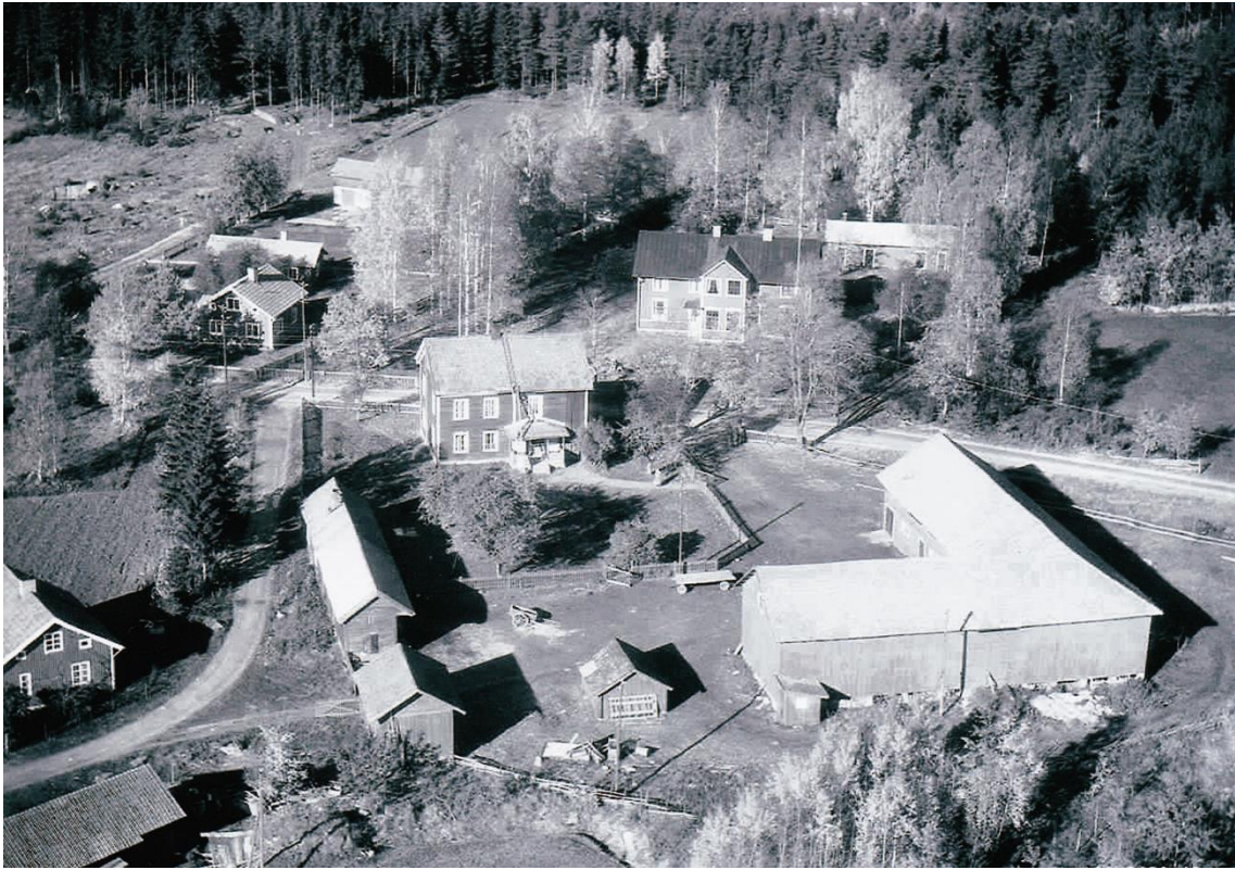
Janses något halvt århundrade senare år 1955.