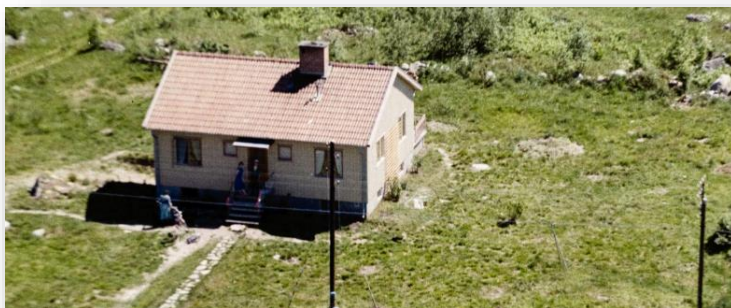
Håkanssons när det var nybyggt på 1950-talet.